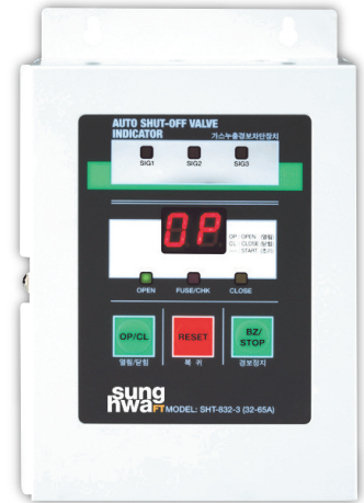
차단 장치 제어부